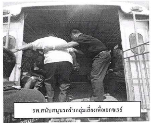
รพ.สนับสนุนรถรับกลุ่มเสี่ยงเพื่อเอกซเรย์