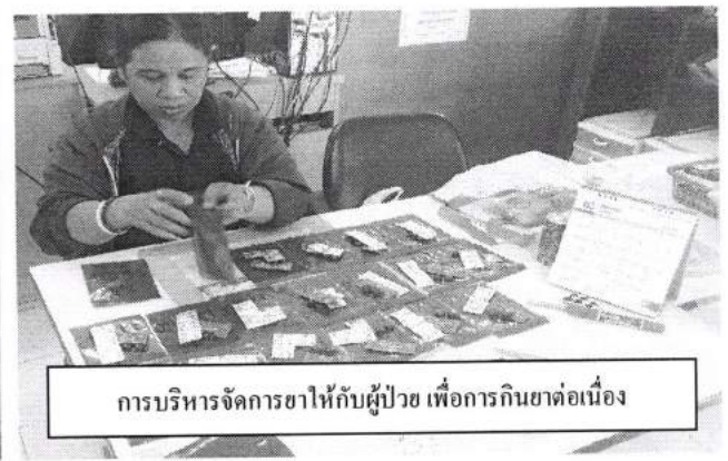
การบริหารจัดการยาให้กับผู้ป่วย เพื่อการกินยาต่อเนื่อง