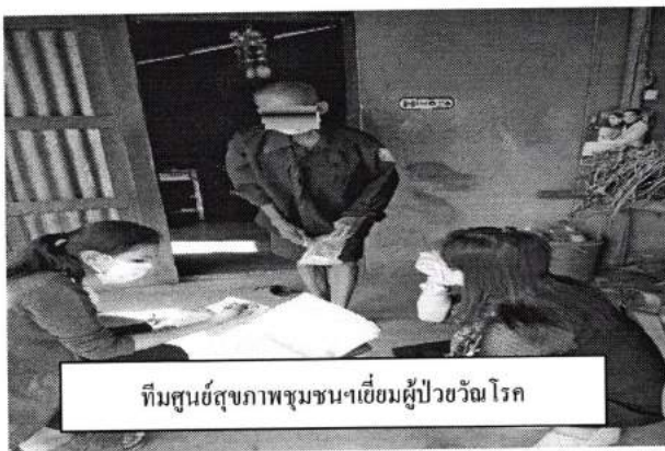
ทีมศูนย์สุขภาพชุมชนฯเยี่ยมผู้ป่วยวัณโรค

4. ผู้ป่วยวัณโรคได้รับการดูแลและกำกับกับการกินยาจนครบสู่ภาวะปกติโดยมีอสม./จนท.เป็นที่เลี้ยง ผู้ป่วยวัณโรคเสมหะบวก เพศชาย อายุ 71 มีโรคความดันโลหิตสูงร่วมด้วย ได้รับการกำกับการกินยาโดย อสม. ผลการรักษา รักษาหาย