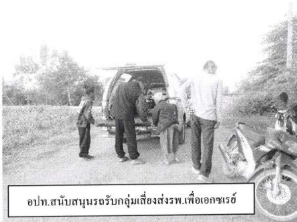
อปท.สนับสนุนรถรับกลุ่มเสี่ยงส่งรพ.เพื่อเอกซเรย์