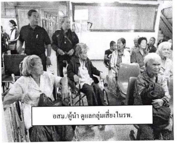
อสม./ผู้นำ ดูแลกลุ่มเสี่ยงในรพ.

4. ผู้ป่วยวัณโรคได้รับการดูแลและกำกับกับการกินยาจนครบสู่ภาวะปกติโดยมีอสม./จนท.เป็นที่เลี้ยง ผู้ป่วยวัณโรคเสมหะบวก เพศชาย อายุ 71 มีโรคความดันโลหิตสูงร่วมด้วย ได้รับการกำกับการกินยาโดย อสม. ผลการรักษา รักษาหาย